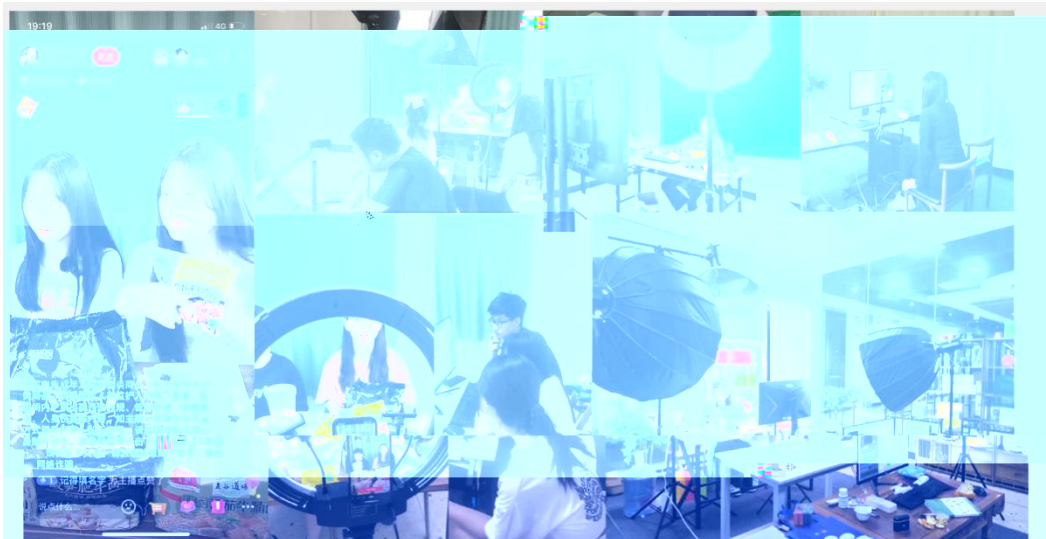
部份学员在进行电商直播实训现场