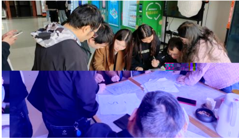
图 卓越团队建设共识营